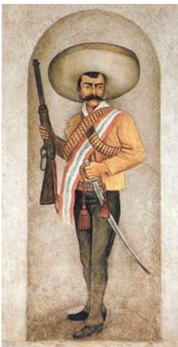
Emiliano Zapata peint par Diego Rivera (1930-1931)

« révolutionnaire », avec sa présidence forte, proclamée par la Constitution de 1917, a nécessité des années de combats internes et externes pour se consolider. Il y avait beaucoup de prétendants au pouvoir, mais presque tous ceux qui ont gagné étaient de grands champions d'une rhétorique révolutionnaire à des fins capitalistes. Le Président Lázaro Cárdenas (1934-1940) a parfois défendu un profond nationalisme, mais il n'a jamais eu l'intention de rompre