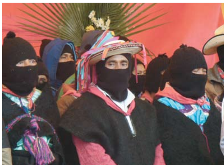
Deuxième rencontre des peuples zapatistes avec les peuples du monde dans les communes autogérées du Chiapas (juillet 2007)

La voix des magonistes a été largement entendue par les néo-zapatistes, dont le soulèvement armé du 1 er janvier 1994 au Chiapas fait écho aux rébellions de près d'un siècle auparavant. Leur slogan est toujours « Terre et Liberté » ; leurs déclarations reprennent souvent les paroles de Ricardo Flores Magón ; ils défendent les peuples indigènes qui constituent leur base sociale avec la paysannerie. Parmi eux, les femmes agissent souvent comme leaders, porte-paroles