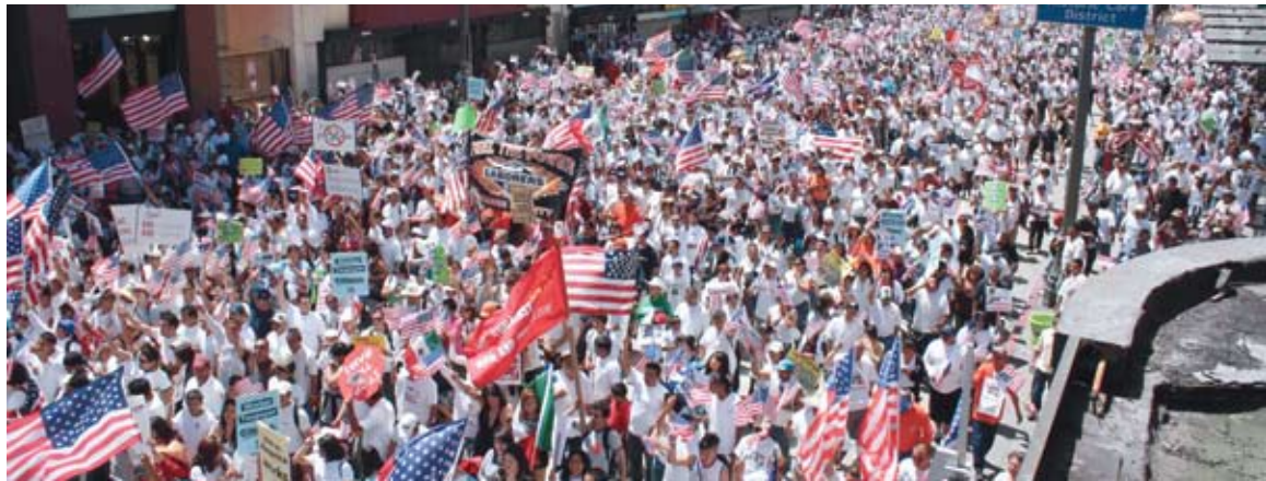
Manifestation du 1er mai 2010 à Los Angeles en faveur des droits des immigrés

le Syndicat mexicain des électriciens (SME) déclarait : « Les objectifs de justice sociale exprimés dans le programme du Parti libéral de Ricardo Flores Magón et dans le Plan d'Ayala d'Emiliano Zapata [...] ont été oubliés. Le Pacte social de 1917 qui a donné naissance à notre Constitution politique est pratiquement en lambeaux et nous souffrons maintenant d'un modèle économique et d'un régime politique qui perpétuent les aspects les plus cruels et les plus honteux du Porfiriato [...] nous autres, les travailleurs, vivons de plus en plus comme à la fin du 19 e siècle ».