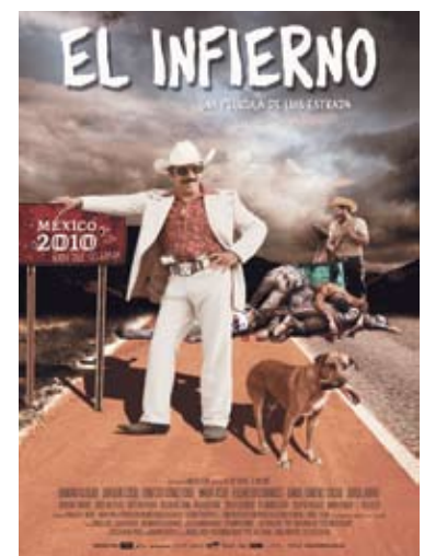
Affiche du film « L'Enfer » de Luis Estrada (septembre 2010), qui tourne en dérision le bicentenaire de l'Indépendance et le centenaire de la Révolution dans un Mexique miné par les inégalités et la violence sur fond de narcotrafic

Ils sont principalement issus du PRI (Parti révolutionnaire institutionnel) et du PAN (Parti d'action nationale), mais sont aussi d'anciens membres du PRI et du PAN qui forment désormais la majeure partie de la direction du PRD (Parti de la révolution démocratique). La plupart sont vénaux. Tous acceptent et servent le système néolibéral du capitalisme contemporain, ainsi que l'intégration économique avec les Etats-Unis à des conditions humiliantes, désastreuses pour la nation,