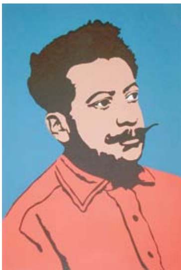
Ricardo Flores Magón

deux frères Jesús et Enrique ont grandi aux côtés des Indiens à Oaxaca. Leurs parents avaient conservé des coutumes communautaires traditionnelles. Ainsi, les frères Flores Magón, à l'exception de Jesús, qui parvint à achever des études de droit, n'eurent jamais assez d'argent pour aller au terme d'une éducation formelle, si bien qu'ils finirent par accepter des petits boulots et devenir des révolutionnaires. Ricardo domine de très loin les deux autres en tant que leader, théoricien et praticien. Tous les trois ont développé leurs idées anarchistes et socialistes avant la fondation du Parti libéral mexicain (PLM).