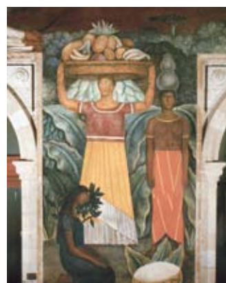
Femmes de Tehuana, peinture murale extraite du cycle Vision politique du peuple mexicain, Diego Rivera (1923)

Si l'homme est réduit en esclavage, vous l'êtes aussi. Les chaînes ne font pas de différence de genre [...] L'horizon du destin des femmes se perd