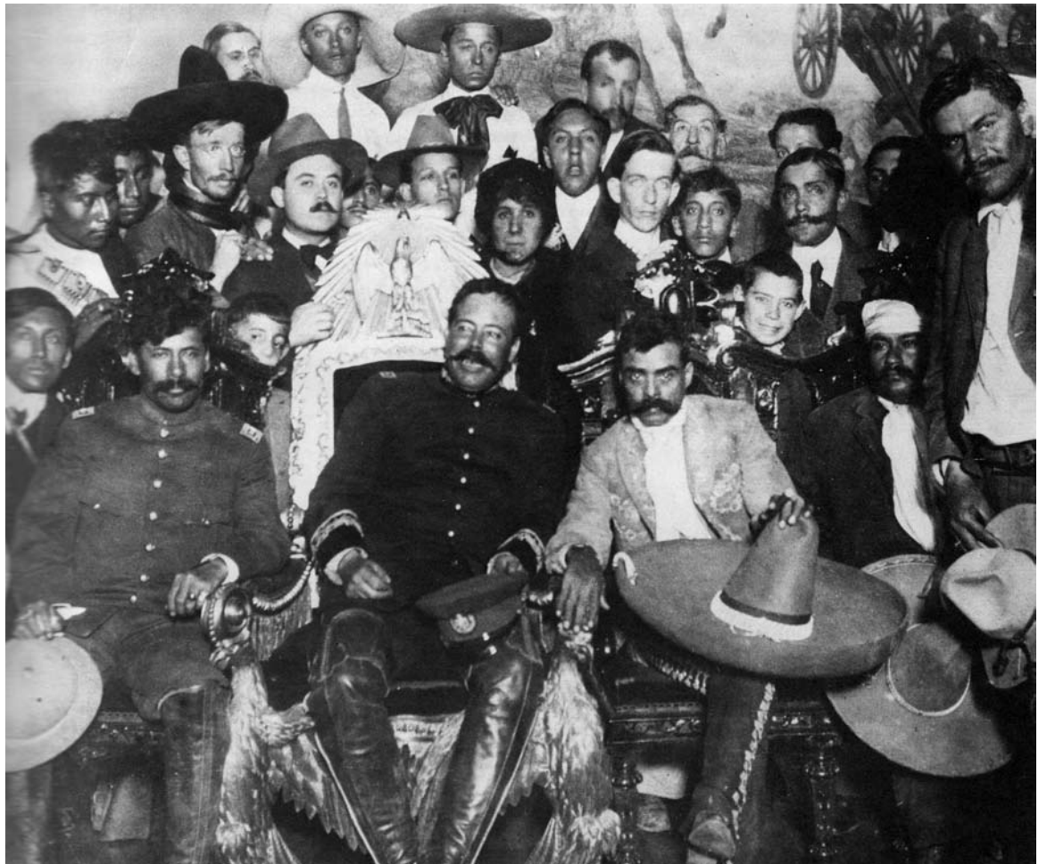
Le 4 décembre 1914, après avoir pris Mexico, Pancho Villa (assis sur le fauteuil présidentiel) et Emiliano Zapata (le sombrero sur les genoux) se retrouvent côte à côte au palais gouvernemental

En 2006, le soulèvement non violent de la population a donné naissance à la « Commune autogérée de Oaxaca », qui a électrisé le monde